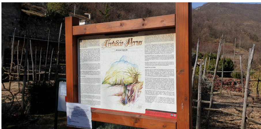
Slika 2. Mikrolokacija Trebišće

Osobitu vrijednost destinaciji Mošćenička Draga daje područje Park prirode Učka koji zauzima ukupnu površinu od 159,38 km 2 , a dio područja koji obuhvaća Općinu Mošćenička Draga iznosi 22,95 km 2 (ili 14% površine Parka). Ovaj prostor jer vrlo atraktivan za razvoj ekoturizma kao specifičnog oblika turizma koji do sada nije razvijen, a isto tako i edukativnog turizma.