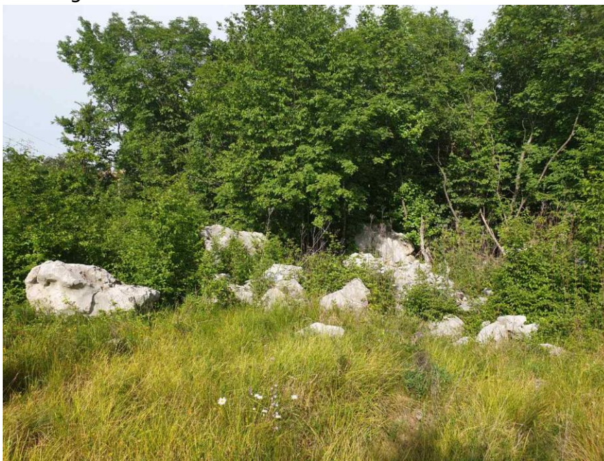
Slika 7. Ostaci kamenog monolita Baba

seže daleko u prošlost, sve do perioda kada je ovo područje bilo mjesto kontakta dvaju različitih naroda: starosjedilaca i Slavena. Ostaci davne povijesti vidljivi su na četiri okolna arheološka nalazišta, od kojih je najvažniji lokalitet Ajdovščina – prapovijesna gradina i drevna obrambena postaja. Rodiško područje jedinstveno je mjesto preplitanja bogate materijalne i nematerijalne kulturno-povijesne baštine: kameni epigraf iz 1. stoljeća pronađen u okolici Rodika, svjedoči o postojanju naroda Rundikta – pra-stanovnika ovog područja, a lokalne predaje i legende pričaju neobične priče o ajdima – mitskim divovima koji su obitavali na istim predjelima. Ajdi su samo mali dio jedinstvene nematerijalne baštine, sačuvane kroz pripovjedne materijale i ovjekovječene u jedinstvenim toponimima u krajoliku koji okružuje Rodik. Na području Rodika nalazi se nekoliko ugostiteljskih i smještajnih objekata, a tokom dvije prepoznatljive manifestacije: „Kostanjev praznik“/Praznik kestena u listopadu i „Opasilo v Rodiku“ u srpnju, Rodik postaje destinacija za stotine posjetitelja iz bliže i dalje okolice. Na području Rodika djeluje turističko društvo koje je aktivno u organizaciji navedenih manifestacija, te kontinuirano potiče stvaranje inicijativa za razvoj turističke ponude.