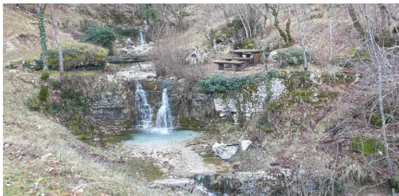
Slika 4. Slap i odmaralište za posjetitelje

Prostorna cjelina mitsko-povijesnih staza Trebišća-Perun ima potencijala da postane turistička atrakcija koja neće biti dostupna turistima samo tijekom ljetnih mjeseci već osobito tijekom vanezonskog razdoblja. Ovakva turistička atrakcija dodatno će pridonjeti prepoznatljivosti i konkurentnosti destinacije na suvremenom turističkom tržištu.