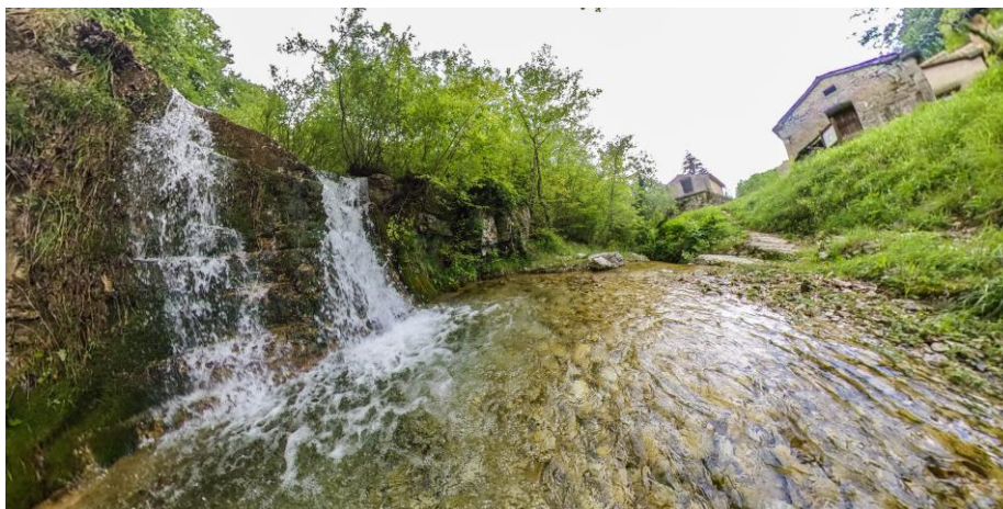
Slika 5. Slap i kućice u Trebišću