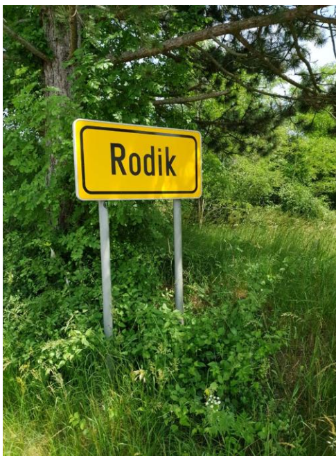
Slika 6. Mikrokacija Rodik

Općina se u svojim naporima za razvoj turizma jasno pozicioniranja u smjeru razvijanja održivog turizma o čemu svjedoči dobivena srebrna oznaka „Slovenia-green destination“, temeljem zadovoljavanja značajnog broja indikatora održivosti, zatim projekt „Zelene iskrice“, kao i kontinuirane investicije u energetska održivost.