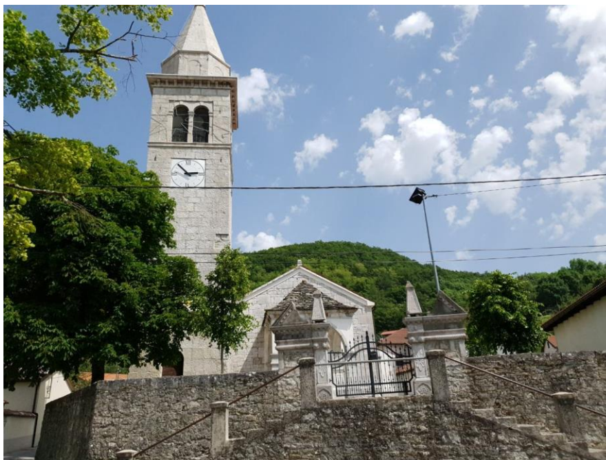
Slika 8. Crkva „Sv. Trojica“ u Rodiku

Skupna čezmejna turistična destinacija za ohranjanje, varstvo in promocijo dediščine mitske krajine prostora Zajednička prekogranična turistična destinacija za očuvanje, zaščitu i promicanje baštine mitskog prostora